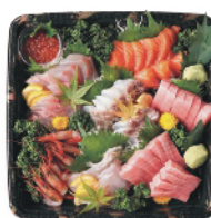
日本各地の漁場からの とれたてを贅沢に盛合せ。