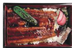
肉厚のうなぎを、コクと甘みのある 自家製タレでじっくり焼きあげ、 ふわっとした食感に。