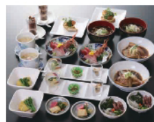
↑ ご宴会スタンダードプランの一例

夜も通常営業中。2時間飲み放題付きご宴会プランも承ります。「スタンダードプラン(1人前5,000円税別)」、「プレミアムプラン(1人前7,000円税別)」