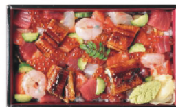
↑ 海鮮バラちらし(1人前)

● 海鮮バラちらし 2700円(税込) ● 特大海鮮 バラちらし (5~6人前) 10800円(税込)