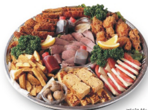
オードブル(大)↑ ご家族で食卓を囲んだ食事や会合など、様々なシーンで重宝します。